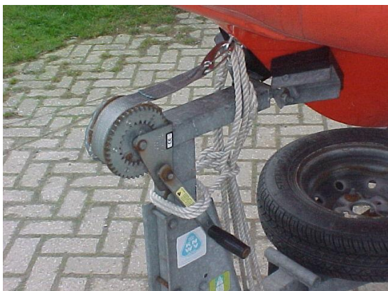
Foto 2: Aan de voorzijde met het landvast op de dissel vastsjorren.

Om de lier extra vast te zetten is het nodig dat de landvast van de boot zo lang mogelijk is. Dat betekent dat de landvast tijdens het varen net niet in de schroef terecht kan komen als hij (onverhoopt) in het water hangt. Is de landvast niet lang genoeg, gebruik dan een extra lijn die je vastmaakt aan het bevestigingspunt van de landvast. Maak met de landvast of de extra lijn een slag om de lierhandel voordat je de lijn recht naar beneden leidt en stevig vastmaakt op de dissel van de trailer.