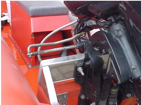
Foto 11: fout: de stuurstang is maximaal uit het stuurhuis en kwetsbaar

Het stuurmechanisme van de motor is zeer kwetsbaar wanneer de motor tijdens het transport naar rechts gedraaid is. De stuurstang is dan namelijk nagenoeg volledig uit het stuurhuis geschoven. Draai de motor daarom helemaal naar links. De stuurstang is dan goed beschermd.